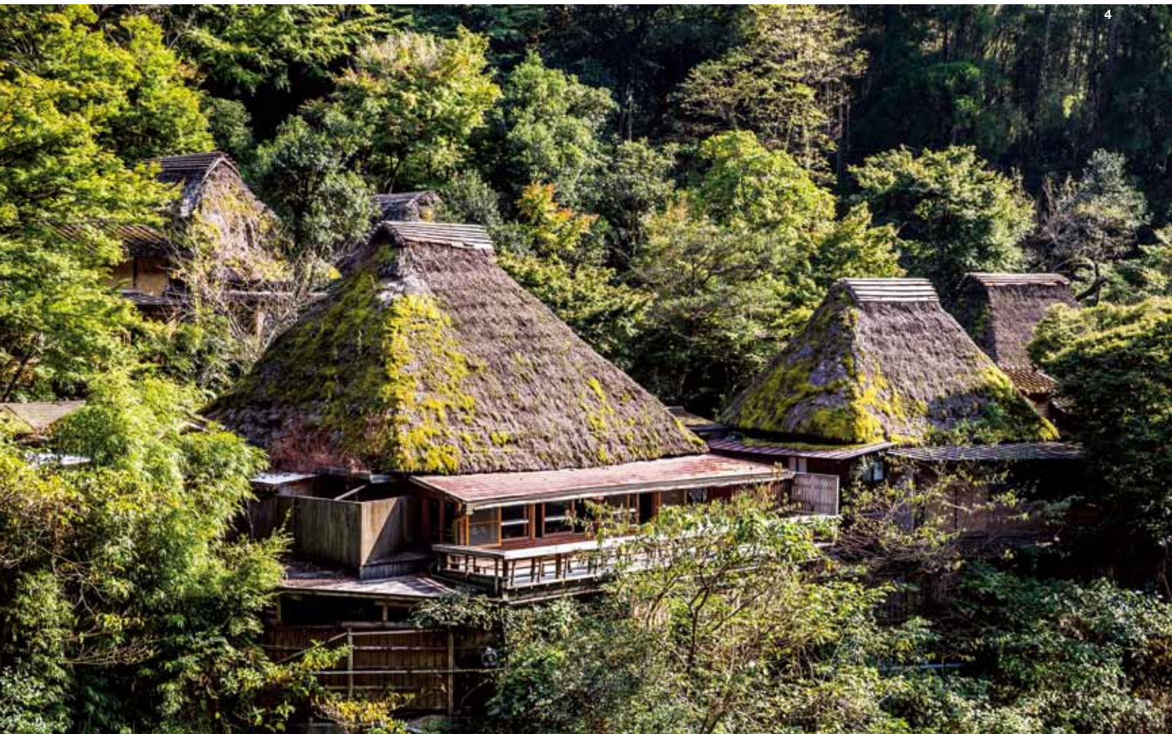
04 わらぶき屋根が印象的な雅叙苑の外観