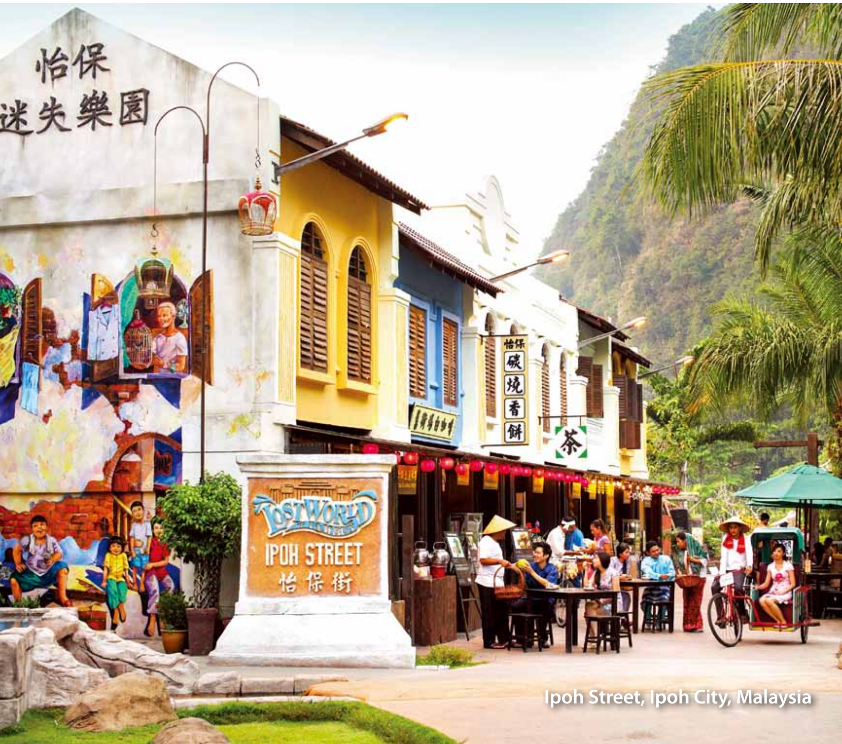
Ipoh Street, Ipoh City, Malaysia

The Official Magazine of the Tourism Promotion Organization for Asia Pacific Cities