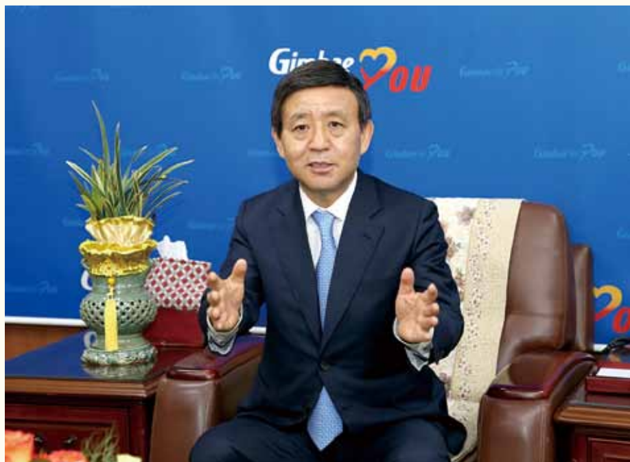
金海市長 ホソンゴン